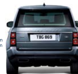
Ancho de vía trasero 1.685 mm