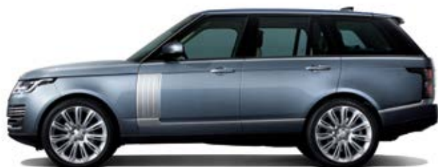
Batalla estándar (SWB) 2.922 mm