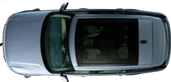
Longitud con batalla estándar 5.000 mm (batalla larga 5.200 mm)