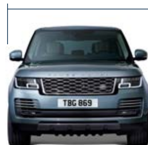
Ancho de vía delantero 1.693 mm

Anchura de 2.073 mm con retrovisores plegados Anchura de 2.220 mm con retrovisores desplegados